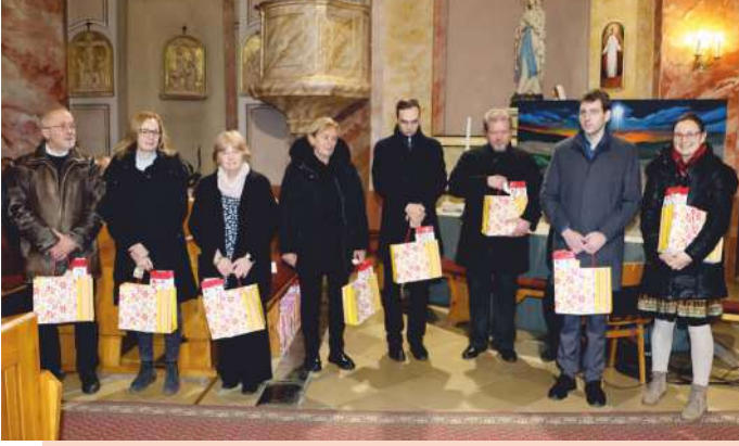
A könyv összeállításában közreműködők