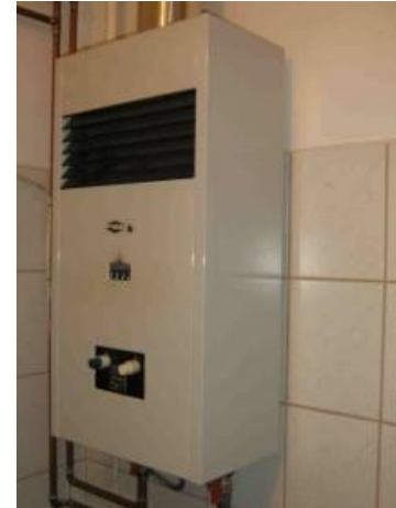
2. ábra "B" típusú gázkészülék

Ebben a kérdésben különösen veszélyes a pontatlan tudás, ami hamis biztonságérzetet teremt! Az utóbbi évtizedben terjedtek el a modernebb, piezo-elektromos gyújtású fűtőkészülékek és vízmelegítők, melyek zárt készülék házzal készülnek , nem látni már sem őrlángot, sem a főégőt. De ettől még nem lesz a gázkészülék zárt égésterű! Alapvetően három gázkészülék-típust különböztetünk meg. Az égéstermék elvezetését és az égési levegő biztosítását „A” típusú (égési levegő hozzavezetés és égéstermék-elvezetés nélküli) készülékek esetében, (pl. gáztűzhely, gázbojler, hőszugárzó) a helyiség megfelelő szellőztetésével kell(ene) megoldani. A „B” típusú (égési levegő hozzavezetés nélküli de égéstermék-elvezetéssel rendelkező) készülékek, (pl. a legtöbb fűtőkészülék és vízmelegítő, valamint a kéményes konvektorok), az égéshez a helyiség levegőjét használják, a füst a kéményen keresztül távozik. A kéményben viszont csak akkor alakul ki megfelelő áramlás, ha az égéshez felhasznált levegő (távozó füstgáz) helyére friss levegő áramlik a helyiségbe. Mivel a fűtőkészülékek üzeme állandó a léghótlás időszakos szellőztetéssel nehezen biztosítható. Öreg épületek rossz