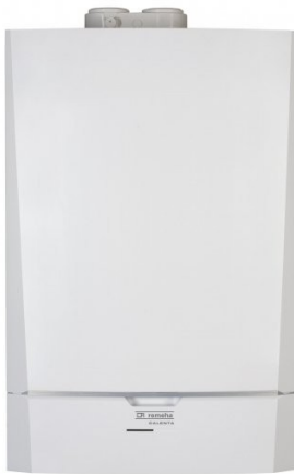
1. ábra "C" típusú gázkészülék

légzárású nyílászárói, egyéb szellőzőkürtők esetlegesen megoldhatják a problémát, azonban a megfelelő működés érdekében erre a célra kifejlesztett légbevezető nyílásokat javasolt beépíteni. Hatványozottan igaz ez a modernebb vagy felújított, fokozott légzárású nyílászárókkal ellátott épületekre, ahol ezek hiányában a CO feldúsulása csak idő kérdése. Jelentősen felgyorsítja a folyamatot, ha a gázkészülékkel egy légtérben valamilyen elszívó berendezést, vagy kandallót, cserépkályhát üzemeltetnek, mivel a kiszívott levegő helyére - szükségszerűen - az egyetlen maradék szabad nyíláson, a kéményen keresztül áramlik levegő, de ez viszont a füstgázzal ellentétes irányú, és a gázkészülék tökéletlen működését okozza. A szakértői vizsgálat egyértelműen kimutatta, hogy a hagyományos (gravitációs) kéményben megvalósuló füstgáz kiáramlás a konyhai elszívó berendezés bekapcsolásakor megfordul és a helyiség felé áramlik vissza. Sajnos a készülék visszaáramlás érzékelője nem erre az esetre készült, termikus elven működik, a forró füstgáz visszatorlódásakor létrejövő hőmérséklet emelkedést érzékeli, a hideg, külső levegővel keveredett füstgáz esetében hatástalan volt. „C” típusú (égési levegő hozzavezetéssel és égéstermék-elvezetéssel rendelkező) készülékek (pl. ún. „turbós” készülékek, kondenzációs kazánok) az égéshez szükséges levegőt a szabadból szívják, oda vezetik - ventilátorral - a füstgázt is. Az égésterűk a helyiségtől gáztömören lezárt, nem fordulhat elő CO mérgezés.