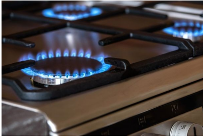
1. ábra "A" típusú gázkészülék

Ebben a kérdésben különösen veszélyes a pontatlan tudás, ami hamis biztonságérzetet teremt! Az utóbbi évtizedben terjedtek el a modernebb, piezo-elektromos gyújtású fűtőkészülékek és vízmelegítők, melyek zárt készülék házzal készülnek , nem látni már sem őrlángot, sem a főégőt. De ettől még nem lesz a gázkészülék zárt égésterű! Alapvetően három gázkészülék-típust különböztetünk meg. Az égéstermék elvezetését és az égési levegő biztosítását „A” típusú (égési levegő hozzavezetés és égéstermék-elvezetés nélküli) készülékek esetében, (pl. gáztűzhely, gázbojler, hőszugárzó) a helyiség megfelelő szellőztetésével kell(ene) megoldani. A „B” típusú (égési levegő hozzavezetés nélküli de égéstermék-elvezetéssel rendelkező) készülékek, (pl. a legtöbb fűtőkészülék és vízmelegítő, valamint a kéményes konvektorok), az égéshez a helyiség levegőjét használják, a füst a kéményen keresztül távozik. A kéményben viszont csak akkor alakul ki megfelelő áramlás, ha az égéshez felhasznált levegő (távozó füstgáz) helyére friss levegő áramlik a helyiségbe. Mivel a fűtőkészülékek üzeme állandó a léghótlás időszakos szellőztetéssel nehezen biztosítható. Öreg épületek rossz