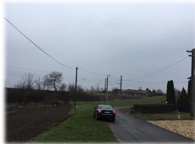
Vasútvonali fényképfelvétel, Bag, Rákóczi utca irányából (2018.03.29)