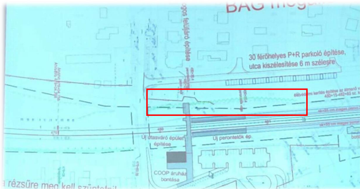
Prezentációban bemutatott, Bag vasútállomás átalakítása tervezete (2018.03.27)

Az Aszódon 2018. március 27-én megtartott lakossági tájékoztató alkalmával elhangzottak, ill. szakértő előadójukkal történt előzetes egyeztetés alapján kérjük a Bag megállóhely, Peresi terület oldalán kialakításra kerülő zajvédő fal tervezett helyzetének felülvizsgálatát, ugyanis véleményünk szerint a prezentáción bemutatott elhelyezésben a zajvédő fal kialakítása nem tölti be a lakóterület melletti zajvédő funkcióját.