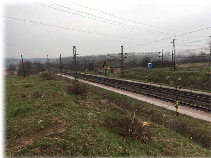
Vasútvonali fényképfelvétel, Bag, Rákóczi utca – Állomás utca sarok irányából (2018.03.29)