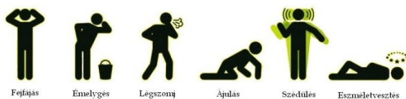
A szén-monoxid-mérgezés tünetei

gyanúját gyakran felfogja, és azt is, hogy meghal, ha nem tesz valamit, egy bizonyos mérgezési fokon túl azonban már nem képes cselekedni. A szénmonoxid mérgezés szakaszai: